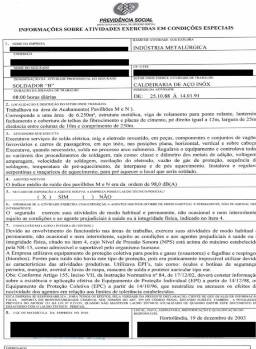
Imagem 01. Formulário DIRBEN-8030

registros anteriores à implantação do PPP (Rosa, 2024). A seguir, a retratação do formulário DIRBEN-8030: