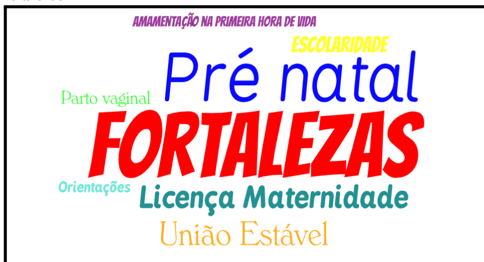
Figura 2: Fortalezas.

Como pode-se observar na figura 2 abaixo encontram as fortalezas que foram: Ter realizado amamentação na primeira hora de vida, com tempo maior de escolaridade, realização do parto vaginal, acompanhamento do pré natal, licença maternidade de 180 dias, estar vivendo em união estável e ter recebido orientações sobre o aleitamento materno.