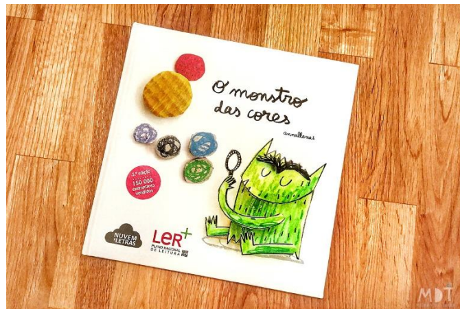
Figura 2: Capa do Livro: O Monstro das Cores