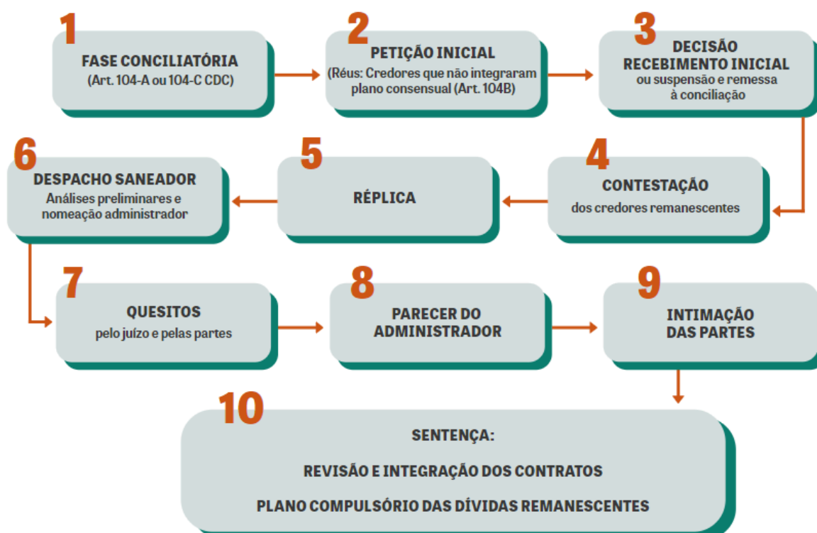
FIGURA 2 - FLUXOGRAMA PROCESSO DE SUPERENDIVIDAMENTO

O fluxograma a seguir, confeccionado pelo Conselho Nacional de Justiça (2022, p. 30) demonstra de forma clara a fase judicial e outra extrajudicial ou pré-processual: